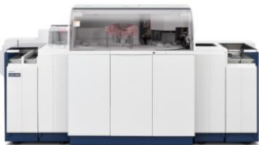
生化学自動分析装置