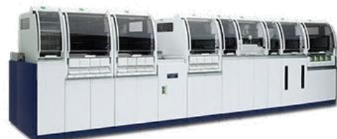
検体検査自動化システム